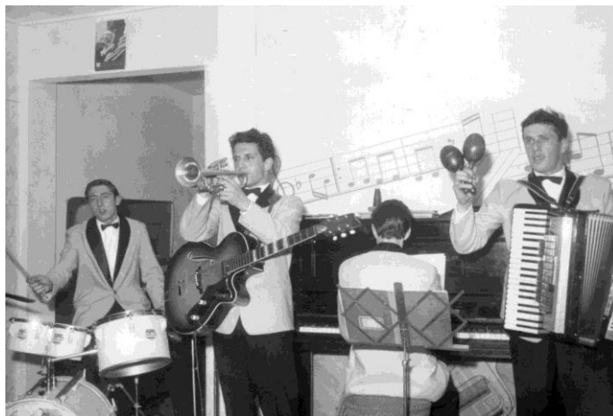
“...suonavamo al Regina, al Bellaria, al Parenti”