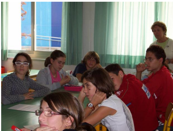
Il gruppo filòteca