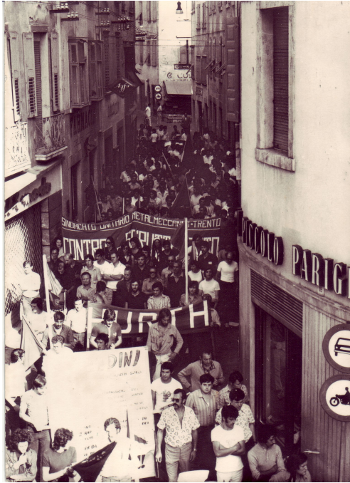
1971 Arco, il corteo sfilava per via Segantini

Gente che girava al largo disapprovando, ma anche gente che veniva ad attaccare briga, ad offendere.