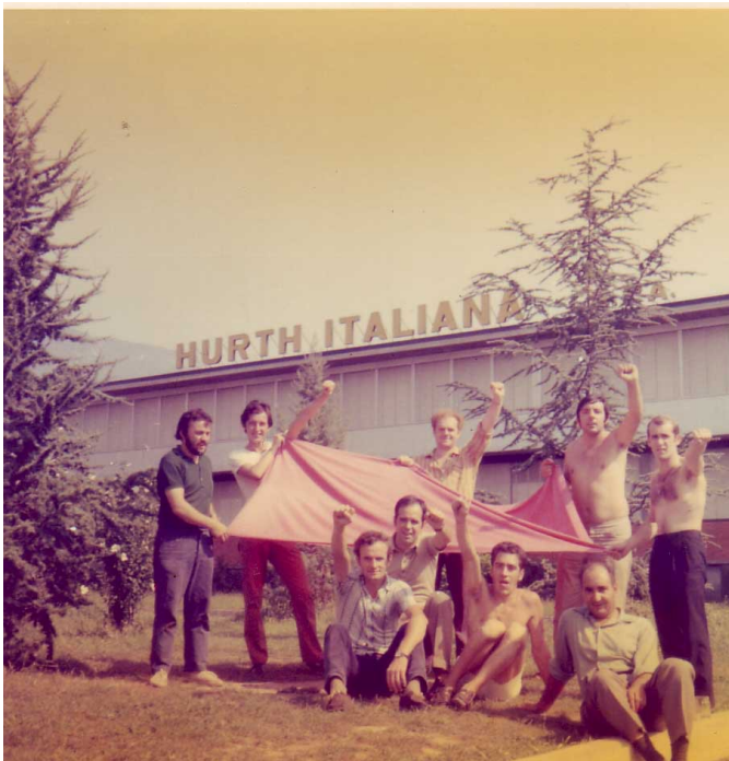
Agosto 1972. Operai in lotta davanti alla fabbrica

settimane, una cosa triste, un'arma tremenda quella della serrata.