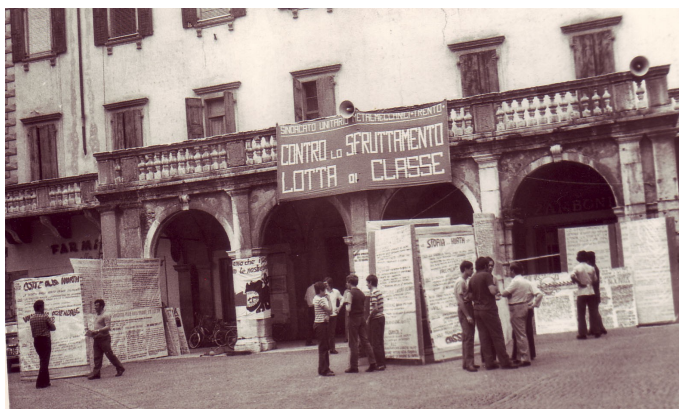
In piazza Tre Novembre per spiegare le proprie ragioni

Facevamo manifestazioni tali da paralizzare tutto il Basso Sarca.