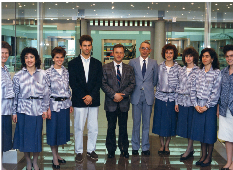
Corrado e commessi nel nuovo negozio

Oggi come oggi, i tessuti non esistono quasi più, c'è solo qualcosa in telerie per bambini o per tovaglie, ma proprio pochissimo. Se non ci fossimo aggiornati oggi saremmo chiusi.