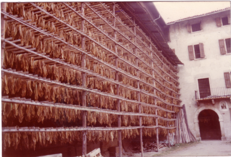
Foglie di tabacco appese e stese ad essiccare

Mi ricordo bene i turni, Madonna come me li ricordo! Si stava fuori delle mezze ore. Bisognava dividere, separare le foglie una dall'altra su stanghette di diversa lunghezza. Ai due lati c'erano dei chiodini, a uno dei quali, da una parte, attaccavi un cappio e poi tiravi e, dall'altra, bloccavi questa stanghetta col filo appeso, su cui dovevi distribuire le foglie e in mezzo si legava perché il filo non doveva fare la "pancia".