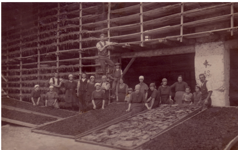
Donne alla Masera nel 1920