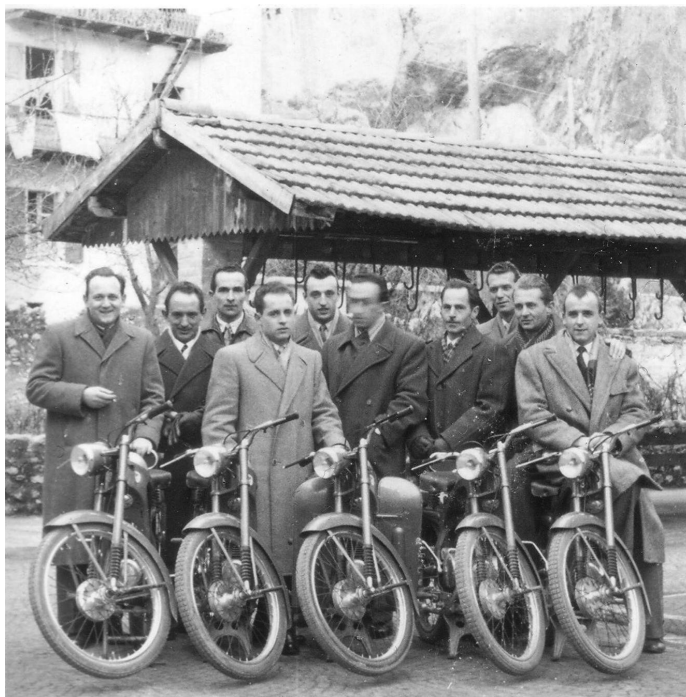
La prima serie di capriolo realizzata

Alla fine si è messo a disegnare il Capriolo 75; il telaio un po' ispirato alla BMW, che gli piaceva moltissimo, anche quello stampato in lamiera, adattandolo al motore 75.