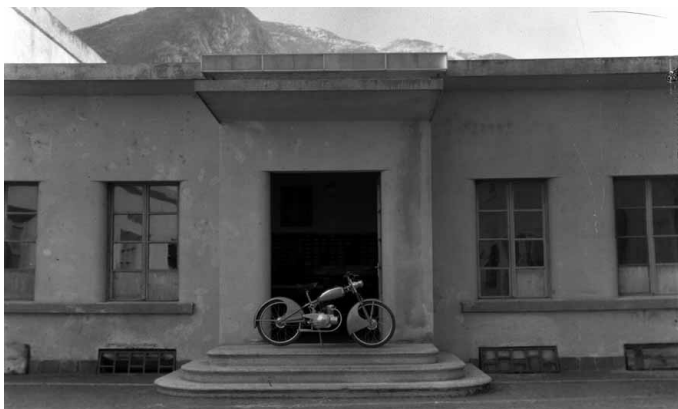
Il Capriolo davanti allo stabilimento

Per me e per quelli che gli volevano bene è stata una grande perdita umana, ma anche alla Caproni è venuto a mancare chi avrebbe potuto portare avanti idee nuove, è stata una rovina.