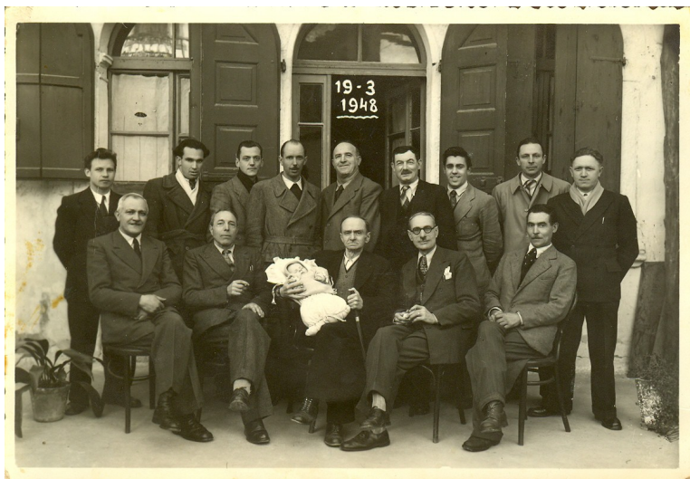
Giuseppe in fasce con tutti i Giuseppe.

un quarto di vino, chi un bicchiere e passavano tutta la serata a chiacchierare perché a quei tempi non c'era la televisione, era un modo per socializzare.