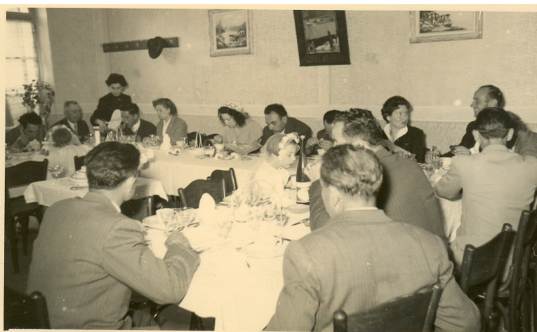
Un matrimonio in sala Glicine

Anche i colleghi di Arco riconoscono ai miei genitori di essere stati pionieri nella ristorazione. Dal 1946 fino agli anni Sessanta, Settanta si facevano molti matrimoni, perché non era abitudine avere tanti invitati come adesso, novanta o cento persone. In genere erano in trenta, trentacinque. Noi abbiamo una bella sala al primo piano che ospita una quarantina di persone. C'è anche il terrazzo con il glicine.