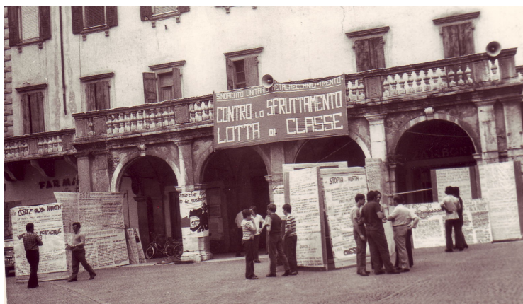
Operai della Hurth in piazza Tre Novembre per far conoscere i loro problemi