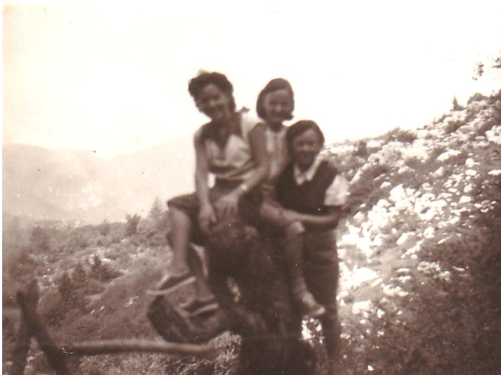
Le sorelle sul Monte Brento nel settembre del 1950

Non c'era l'orso ma si raccontava che una donna, che abitava in una casa vicino alla malga, era rimasta qui sola e lo avesse incontrato. Il marito era sceso ad Arco e si è assentato per un giorno ed una notte. In quel periodo S. Giovanni era deserto; anche la malga era ormai chiusa. E' venuto l'orso e la donna, con un figlio molto piccolo, si è barricata in casa ma è impazzita dalla paura sentendo l'animale fuori dalla porta che raschiava.