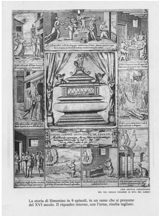
La storia di Simonino in 9 episodi, in un rame che si presume del XVI secolo. Il riquadro interno, con l'urna, risulta tagliato.

tipografia nuovi sistemi produttivi che si basavano, come avevo detto prima, sull'ottica, quindi sulla fotocomposizione e sulla composizione secondo sistemi computerizzati.