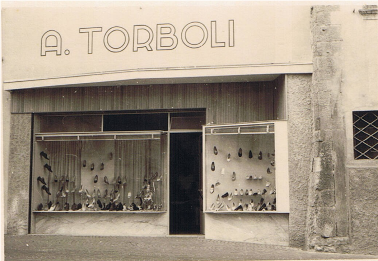
1958 Il negozio dopo il restauro .