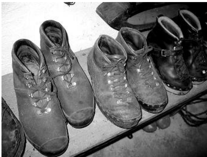
Scarponi da lavoro con brocche di Prè

quindi inizialmente non sapevo nemmeno dove fossero i fornitori. Naturalmente poi ho fatto la mia esperienza.