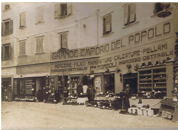
Il negozio in un'immagine del 26 luglio 1922

Nel 1955 mi sono sposato e da allora mia moglie è stata una validissima collaboratrice, lei era appassionata della presentazione delle vetrine e ci si è dedicata, perché noi prima buttavamo lì la roba, con un certo gusto, ma senza studiarci su troppo. Ci aiutava anche la mia matrigna, una donna rigida ma valida che si è sacrificata per noi e ricordiamo con affetto.