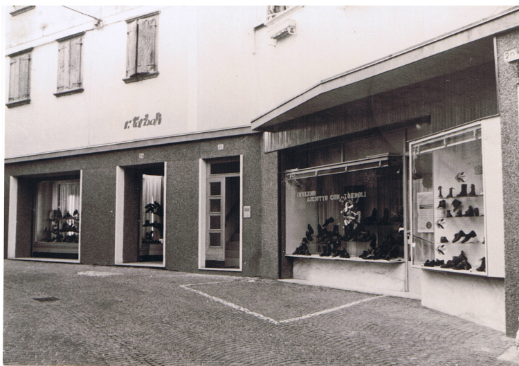
Il negozio negli anni Settanta