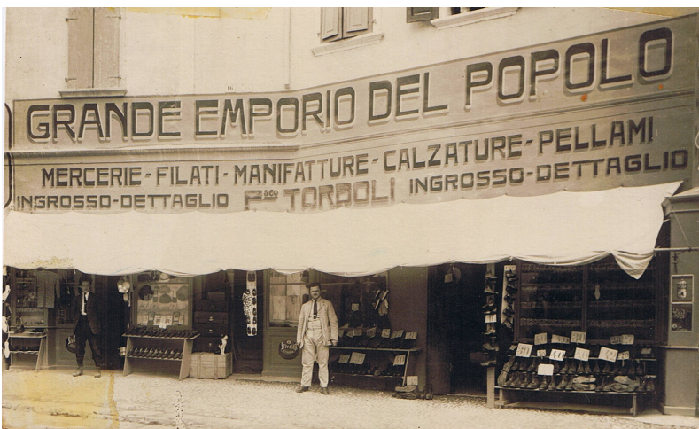
Il negozio sempre negli anni Venti