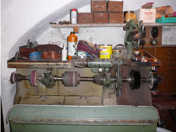
“banco da finissaggio”

Mi ricordo quando quel ragazzo lavorava con lui e imparava da lui, che differenza dall'apprendistato di oggi!