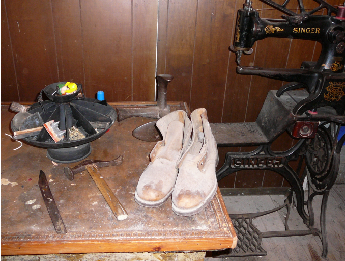
“Tavolo da lavoro Villi”

A quel tempo le scarpe le creavi a mano o le incollavi, le rammendavi, un lavoraccio del quale non mettevi in conto il tempo. Parliamo degli anni Cinquanta, Sessanta: una riparazione costava due o tre cento lire, ma il tempo che usavi, o si può più giustamente dire perdevi, non veniva contato.