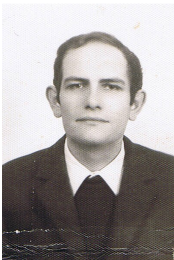
1972 rappresentante sindacale

Imparai così partendo da esigenze immediate prospettate dai miei compagni di lavoro, a studiare e conoscere i contratti di lavoro, la legislazione sociale, la storia del sindacato, l'economia aziendale, le teorie economiche, il modo di costruire le rivendicazioni e di selezionare le priorità e le gradualità delle stesse, il metodo della contrattazione e le regole della stessa.